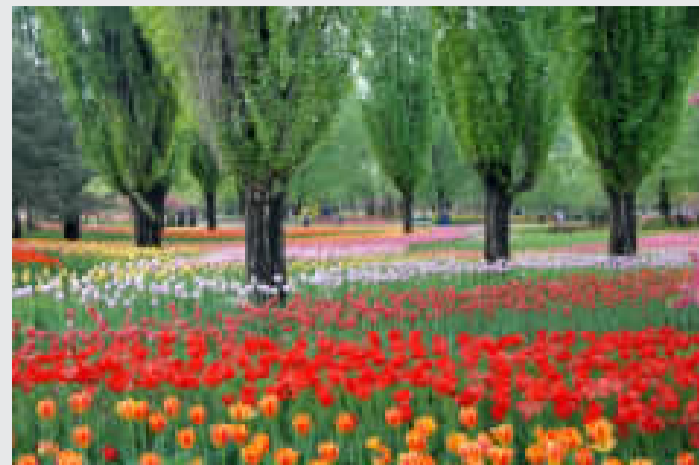
春色满园

中队活动要寓教于乐,吸引广大队员。一个好的活动会让队员们增长一个知识、提高一项技能、感悟生活中一个道理……丰富多彩的中队活动将会春风化雨般滋润队员心田,让他们在快乐中健康成长。